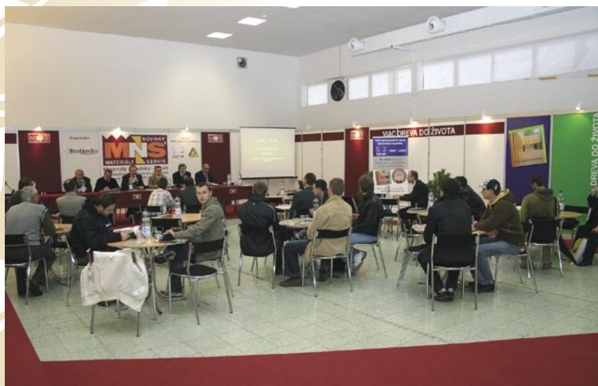
Záujem o MNS odborný program, ako aj komerčné prezentácie každým rokom rastie a je na škodu tých, ktorí sa ich nemohli zúčastniť. MNS diskusné fórum je zároveň súčasťou kampane „Viac dreva do života“, ktorej cieľom je zvyšovať odbyt produktov na báze dreva.