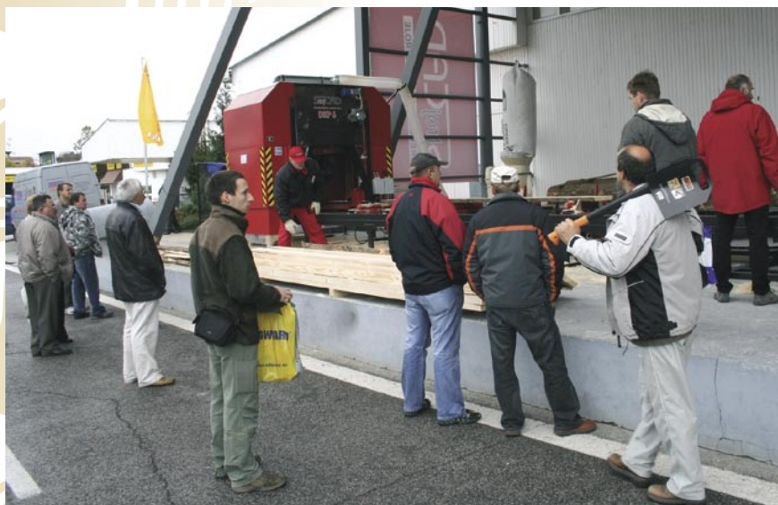
Ocenená dvojkotúčová uhlová kmeňová píla DKP6 Hydro z produkcie StrojCAD, s. r. o., Michalovce pútala pozornosť návštevníkov veľtrhu