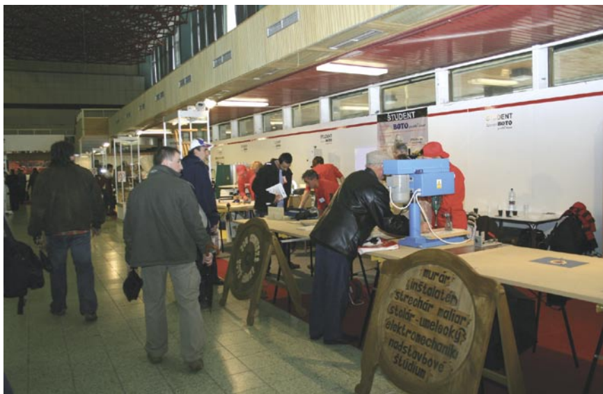
V pavilóne C bolo umiestnené študentské predváždzacie centrum s ukázkami prác študentov odborných škôl drevárskeho zamerania.

Paralelne s veľtrhom DREVO + LES sa opäť stretli vystavovatelia a návštevníci výstavy MNS – Materiály, Novinky, Servis pre nábytkársky a drevársky