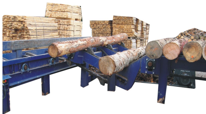
Doprava kulatiny do pilnice