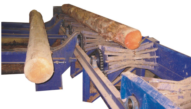
Doprava kulatiny v pilnici