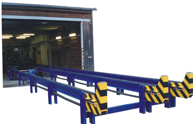
Zásobní dopravník kulatiny